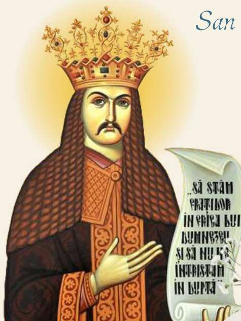
San Neagoe Basarab

La monja Platonida, conocida en el mundo como la Princesa Milica Despina, fue esposa del Santo Príncipe Neagoe Basarab. Pertenecía a la familia Brancovic, siendo sobrina del Metropolitano San Maxim Brancovic. Se casó con San Neagoe Basarab en 1505 y tuvieron seis hijos, tres de los cuales murieron jóvenes. Tras la muerte del príncipe en 1521 y la pérdida de su hijo, se refugió en Sibiu con sus hijas. Apoyó activamente fundaciones religiosas y culturales, incluyendo el Monasterio de Curtea de Argeş, la Ermita de Ostrov y el Monasterio de Kruşedol. En 1545 fue tonsurada como monja con el nombre de Platonida y vivió en Sibiu hasta su fallecimiento el 30 de enero de 1554.